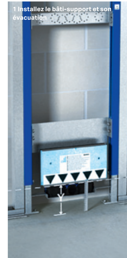
1 Installez le bâti-support et son évacuation

Plus d'informations sur l'installation du bâti-support pour douche de plain pied sur : → www.geberit.fr/douche-italienne