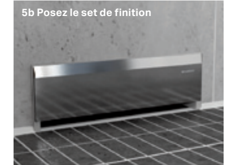
5b Posez le set de finition