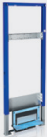
Bâti-support Duofix PLUS douche de plain pied pour robinetterie murale apparente

Robinetterie : murale encastrée Champ d'application : pour construction neuve ou rénovation, pour pose en applique