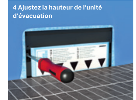
4 Ajustez la hauteur de l'unité d'évacuation