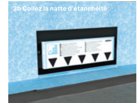
3b Collez la natte d'étanchéité