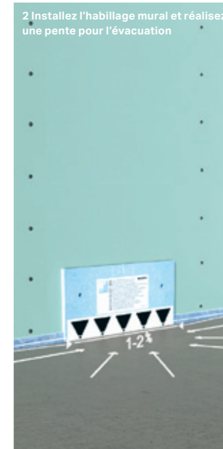
2 Installez l'habillage mural et réalisez une pente pour l'évacuation