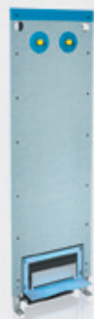
Bâti-support d'angle Uniflex douche de plain pied pour robinetterie murale apparente

Robinetterie : déportée Champ d'application : pour construction neuve ou rénovation, pour pose en applique