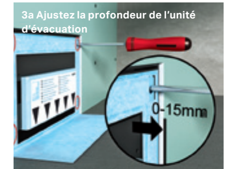
3a Ajustez la profondeur de l'unité d'évacuation