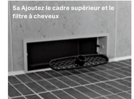
5a Ajoutez le cadre supérieur et le filtre à cheveux