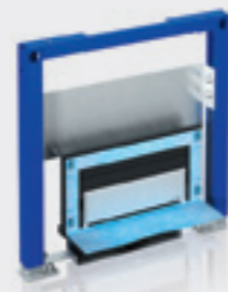
Bâti-support Duofix PLUS douche de plain pied pour robinetterie déportée

Robinetterie : murale apparente Champ d'application : pour construction neuve ou rénovation, pour pose en applique