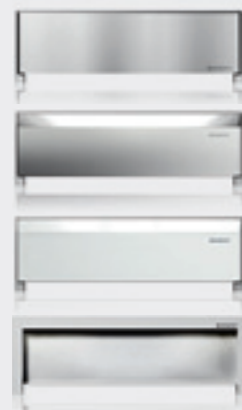
Set de finition

Robinetterie : murale apparente Champ d'application : pour construction neuve ou rénovation, montage en angle, revêtement prémonté, prêt à être carrelé