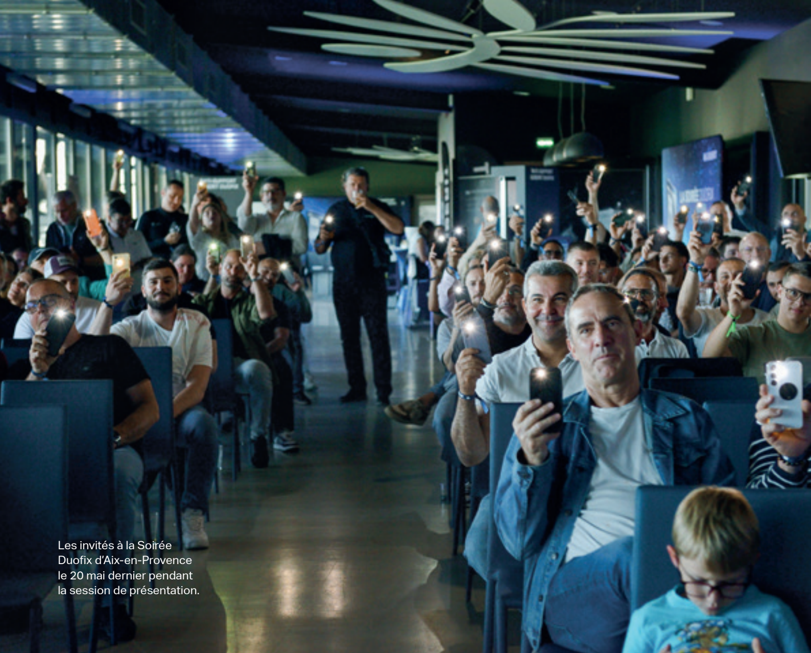
Les invités à la Soirée Duofix d'Aix-en-Provence le 20 mai dernier pendant la session de présentation.

DES SOIRÉES D'EXCEPTION POUR LE LANCEMENT DU NOUVEAU BÂTI-SUPPORT DUOFIX