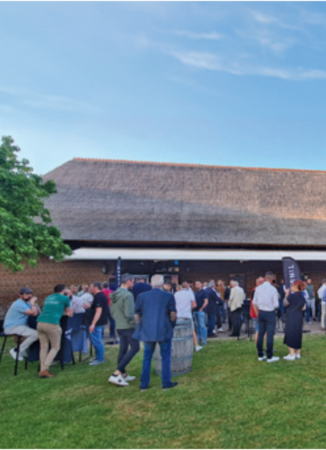
↑ Accueil des invités lors de la Soirée Duofix à Lille le 13 mai 2025

Chaque soirée a été pensée pour mêler convivialité et contenu technique. Les participants ont pu découvrir les nouveautés du bâti-support Duofix, échanger avec nos équipes et bénéficier de démonstrations concrètes. Un temps fort pour renforcer les liens, transmettre notre expertise et valoriser le métier d’installateur, entre buffet gourmand, cocktail, atelier démonstratif, quiz et animations.