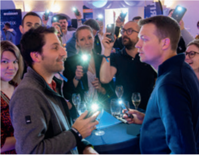
↑ Convivialité et partage lors de la Soirée Duofix à Reims le 28 mai 2025